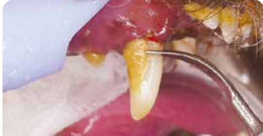
重度の歯垢・歯石の沈着した症例に対し、麻酔下で超音波スケーラーを使用してスケーリングを行っているところ。

病院内では、沈着してしまった歯垢や歯石をスケーリング、ポリッシングして、キレイにすることができます。