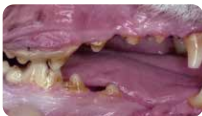
症例：9歳齢 避妊雌の雑種