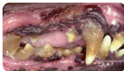
症例：9歳齢 雌のダックスフンド