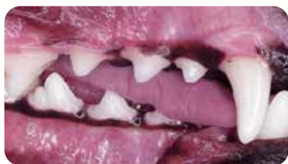
症例：1歳齢 雌のダックスフンド