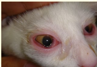
ネコヘルペスウイルスによる結膜炎

獣医師の指示により 正しくお使いください。 目の痛みなど目の異常が あった時には獣医師に ご相談ください。