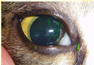
ネコヘルペスウイルスによる角膜炎 (フルオレセイン染色)